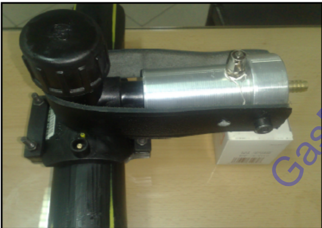
نحوه اتصال T.S.C. به TAPPING SADDLE