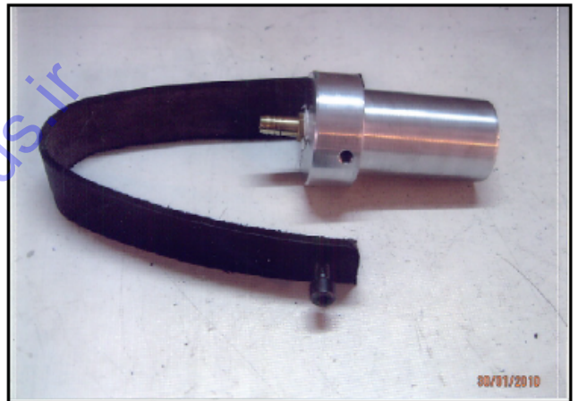
TAPPING SADDLE CONNECTOR(T.S.C.)