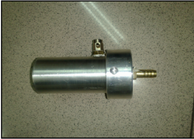
TAPPING SADDLE CONNECTOR (بدون BELT)